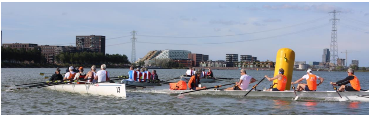
Ronde om de boeien tijdens de race.

Ter ere van ons 150-jarige en het 5-jarige roei-jubileum van WV IJburg is er een extra race gevaren: de bestuursvieren. Zelfs het bestuur van de KNRB deed mee. Eigenlijk had dat bestuur geen schijn van kans, want zij verschenen door logistieke hindernissen te laat aan de start en normaliter is de regel dan coastal wedstrijden dan 'pech gehad', maar op de roeibond wilde men wel wachten. Ook deze bonusrace was spannend tot het laatste moment, het bestuur van KNZ&RV Muiden won de wedstrijd, De Amstel kwam als tweede over de streep.