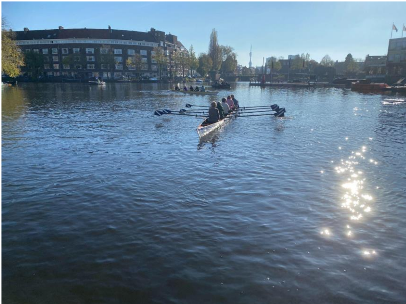
Bij de infodag kunnen nieuwe leden na afloop gelijk al in de boot.

Wat ons al langer opviel is dat de laatste groep bijna nooit kwam opdagen op de infodagen. Halverwege het jaar bellen we daarom inschrijvers zodra ze voor ons zichtbaar zijn op E Captain. Het gevolg is dat iedereen nu komt opdagen en dat levert meer leden op. Met degenen die niet op zondag kunnen komen, spreken we apart af. Om eerste twijfels bij nieuwe leden weg te nemen, kunnen zij vanaf november ook gelijk in de boot stappen. Aan Jong Amstel hebben we gevraagd om jongere leden aan de infomiddagen mee te laten doen zodat we een diverser beeld kunnen geven van wie de Amstelleden zijn.