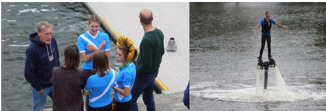
Instructeurs, coaches en jeugdleden tijdens de Onderlinge.